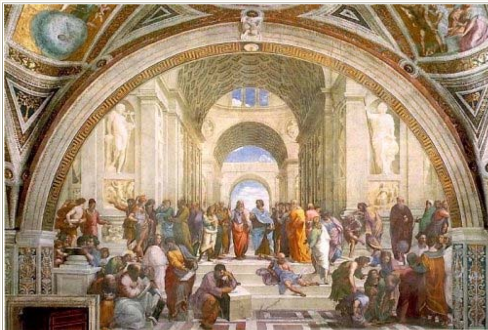
Φιλοσοφική Σχολή της Αθήνας, όπως την εμπνεύστηκε ο αναγεννησιακός Ραφαήλ Σάντσιο. Πάτημα με το ποντίκι στην εικόνα παρουσιάζει μια αναλυτική περιγραφή.

Ο Πλάτων περιγράφει στα γραπτά του μια ουτοπική πολιτεία, όπου έχει καταργηθεί η οικογένεια, τα παιδιά αποχωρίζονται από τους γονείς τους για να ανατραφούν από την πολιτεία, ενώ η εξουσία ανατίθεται στους φιλοσόφους (=μορφωμένους), οι οποίοι είναι και οι μόνοι που μπορούν να γνωρίζουν τι είναι αγαθό , άρα και σωστό . Οι φιλόσοφοι εξάλλου βλέπουν τον κοινό παρανομαστή σε καθετί που αποκαλείται ωραίο , οπότε και οδηγούνται στην ίδια την ομορφιά, την αγνή, αμόλυντη, αμίαντη από την ανθρώπινη σάρκα, στην ίδια τη θεϊκή ομορφιά. Κάτω από τους φιλοσόφους είναι οι φύλακες-πολεμιστές, οι οποίοι απαλλάσσονται από βιοποριστικά προβλήματα και είναι αφοσιωμένοι στα αστυνομικά και στρατιωτικά έργα τους, με κύριο σκοπό τη διαφύλαξη του πλατωνικού πολιτικού καθεστώτος. Και τις δύο αυτές ομάδες τις στηρίζει ο « όγλος » με τη δουλειά του, ο οποίος « δεν επιτρέπεται να πολυπραγμονεί αλλά πρέπει να δουλεύει! » Σκέψεις για πνευματική αναβάθμιση όλο και περισσότερων ανθρώπων και συμμετοχή τους στους κύκλους των « φιλοσόφων » είναι ξένες στο μυαλό των διανοουμένων του 4 ου π.χ. αιώνα και παρουσιάζονται ως δημόσιος προβληματισμός μόνο από την εποχή του Ευρωπαϊκού Διαφωτισμού και μετά.