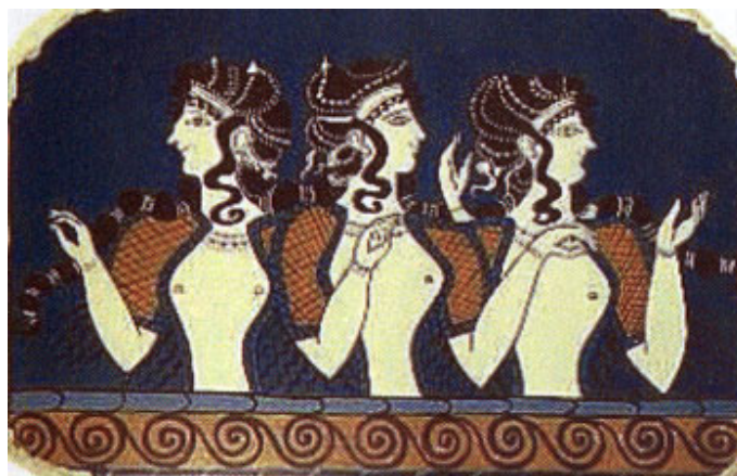
Καλλιπλόκαμοι και εϋπλόκαμοι γυναίκες –όπως και η Κίρκη, από τοιχογραφία της Μινωικής εποχής. Πρόκειται για άριστη περιγραφή του Ομήρου, που ίσως έγινε, προκειμένου να παρομοιασθεί με απλά λόγια το DNA.

• Όταν ο Όμηρος περιγράφει κάποιο πρόσωπο, συνήθως εκτός από το όνομα χρησιμοποιεί κι ένα ή περισσότερα επίθετα, που το προσδιορίζουν καλύτερα. Τα επίθετα που χρησιμοποιεί για την Κίρκη είναι: πολυφάρμακος (κ 276), πότνια (σεβαστή: κ 549), καλλιπλοκάμοιος (κ 220) και εϋπλόκαμος (κ 136 και λ 8). Το πολυφάρμακος και το πότνια μπορούν εύκολα να εξηγηθούν, γιατί, όπως αναφέρει ο ποιητής, ήταν θεά (αδελφή του Αιήτη, κόρη του Ήλιου και της κόρης του Ωκεανού Περσηίδας ή κατ' άλλους της Εκάτης). Για να επιμένει όμως ο Όμηρος, που πάντα ακριβολογεί, σε τρία σημεία μάλιστα στην περιγραφή, ότι η Κίρκη είχε καλούς πλοκάμους, πρέπει να είναι πολύ σημαντικό, κι ασφαλώς δεν πρέπει να αναφέρεται στην κόμμωσή της.