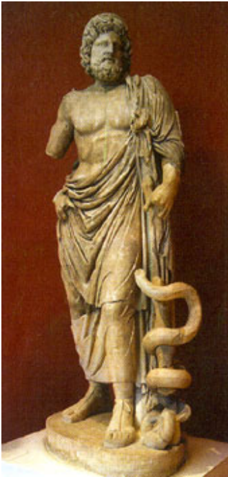
Αγαλμα του Ασκληπιού από το ιερό της Επιδαύρου. (Εθνικό Αρχαιολογικό Μουσείο.) Κάτω δεξιά το φίδι, που ελίσσεται γύρω από ένα ξύλο – συχνή παραλλαγή των δύο φιδιών, που ελίσσονται μεταξύ τους.