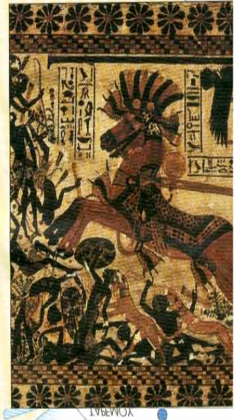
Φωτογραφία από το ένθετο του Βήματος ΙΕΡΟΙ ΤΟΠΟΙ & ΘΡΗΣΚΕΥΤΙΚΑ ΜΝΗΜΕΙΑ